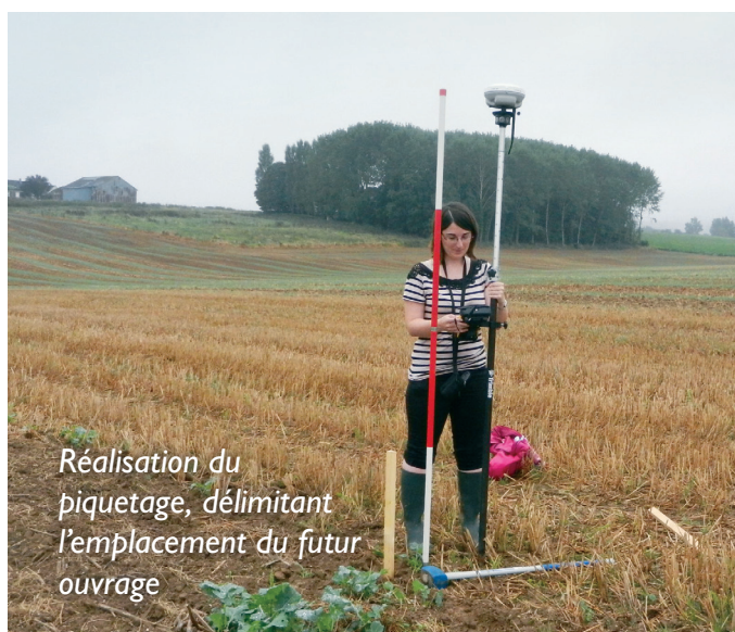
Réalisation du piquetage, délimitant l'emplacement du futur ouvrage

Les ouvrages en gabions sont constitués de roches et galets de différentes tailles qui filtrent les particules solides présentes dans les coulées de boues ; ces pierres sont retenues par un grillage métallique.