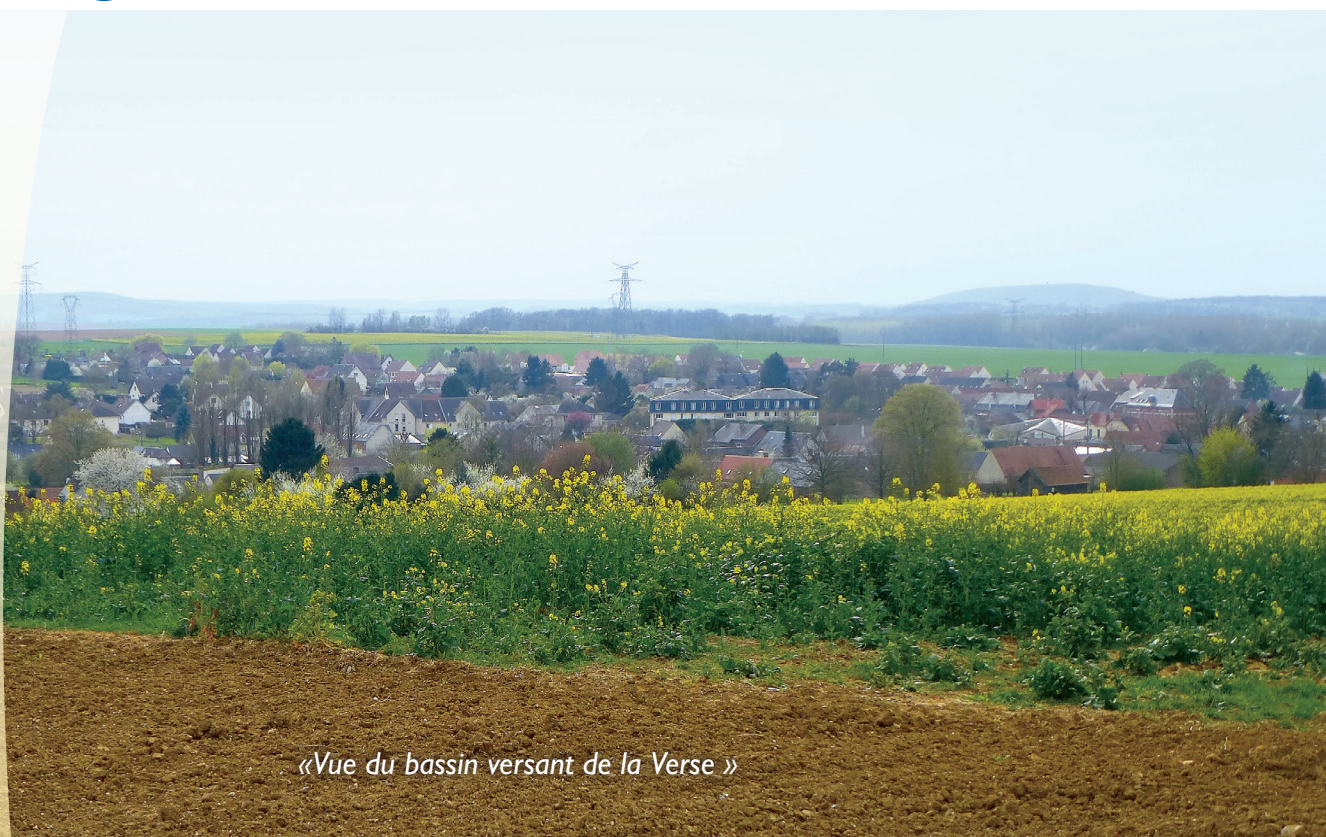
«Vue du bassin versant de la Verse »

Avricourt Beaugies-sous-bois Beaulieu-les-Fontaines Beaumont-en-Beine Beaurains-les-Noyon Berlancourt Bussy Campagne Candor Catigny Crisolles Ecuville Flavy-le-Meldeux Fréniches Frétoy-le-Château Genvry Golancourt Guiscard Guivry Lagny Le Plessis-Patte-d'Oie Maucourt Morlincourt Muirancourt Noyon Ognolles Pont-l'Evêque Porquericourt Quesmy Salency Sempigny Sermaize Vauchelles Villeselve